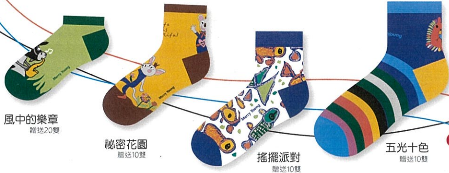
風中的樂章 贈送20雙